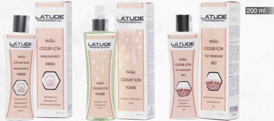
YAĞLI ve KARMA CİTLER İÇİN

İnternet satışı yasaktır. Yalnızca güzellik salonlarına satılır.