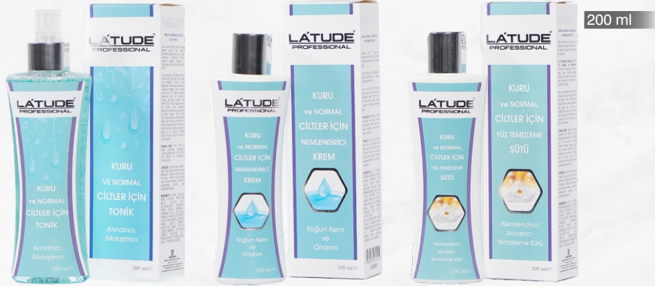
KURU VE NORMAL CİTLER İÇİN